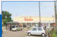
スーパー原信(徒歩7分)