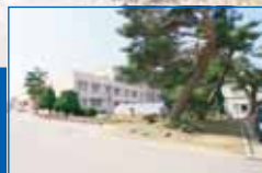
関原中学校(徒歩6分)