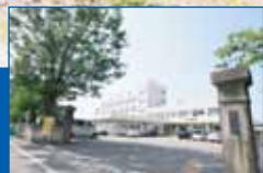
関原小学校(徒歩6分)