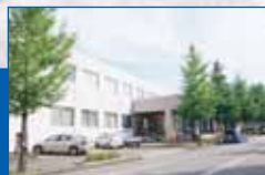
長岡西郵便局(徒歩10分)